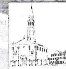
Parrocchia San Rocco Dolo

Prenotazioni entro mercoledì 22 gennaio in sacristia o al numero 3396980449